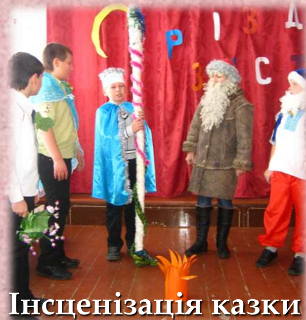
Інсценізація казки "Дванадцять місяців"