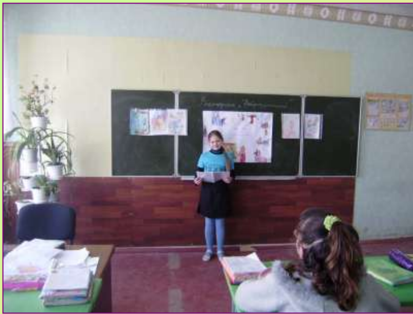
Конкурс читців власних віршів